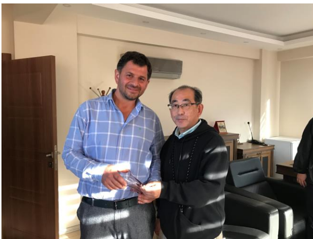
上田座長による記念品贈呈