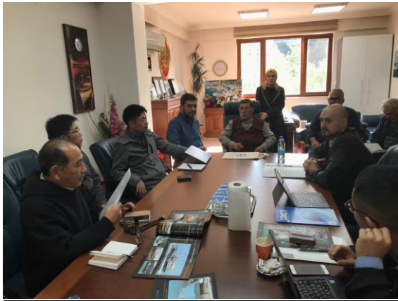
会員企業による製品紹介の様子