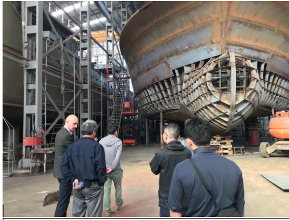
造船所見学の様子