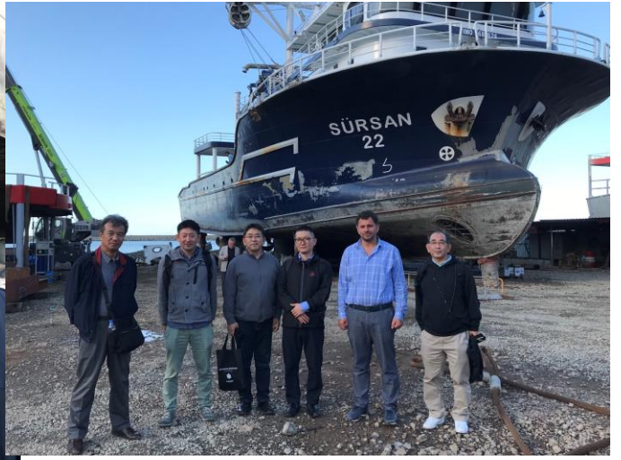
造船所見学の様子