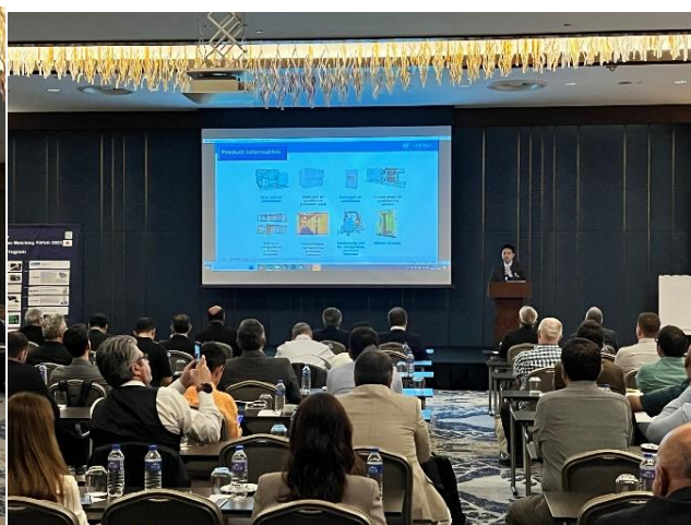
プレゼンテーションルームの様子