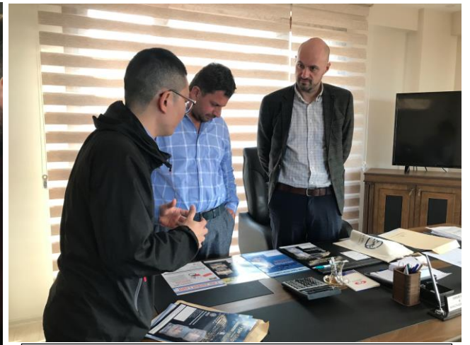
会員企業からの製品 PR の様子