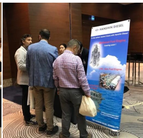
各社商談デスクの様子